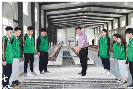
道路与桥梁工程轨道实训中心。

作为新中国第一所公路交通类专门学校, 辽宁省交通高等专科学校(简称辽宁交专)多年来为交通运输行业培养和输送了大批优秀的技术技能人才。2019年12月, 辽宁交专入选“中国特色高水平高职学校和专业建设计划”(简称“双高计划”)建设名单, 并于今年6月举办“双高计划”建设启动大会。